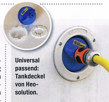
Universal passend: Tankdeckel von Heosolution.