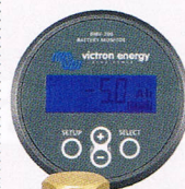
Batteriewächter der BMV-700-Serie mit Display und Shunt.

Da die neuen Batteriewächter über dieselben Abmessungen verfügen wie die Geräte der vorhergehenden BMV-600-Serie soll ein Upgrade jederzeit einfach möglich sein. Auch ein alter Shunt kann weiter genutzt werden. Preise auf Anfrage. Info: Telefon 080 66/884 72 46, www.victronenergy.de