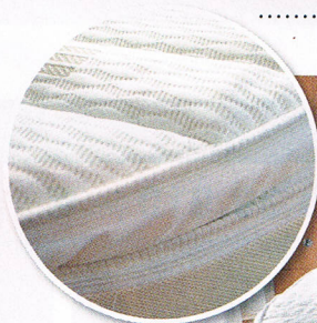
Der Matratzentopper ist ab Frühjahr für verschiedene Betten erhältlich.

Für die Verzögerung sorgt wahlweise die Kombination aus Rücktritt und Felgenbremse oder Felgenbremsen vorne und hinten. Zu haben ist das Vitali Tour ab 2199 Euro. Info: Telefon 093 43/62 70 57 10, www.elektro-rad-mott.de